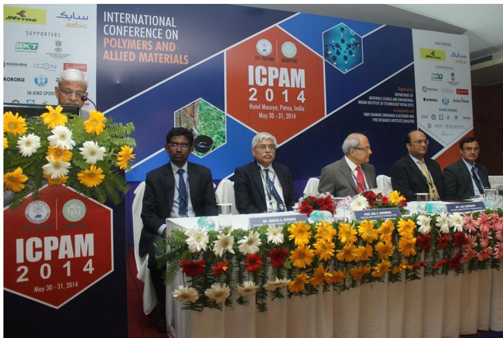
आईसीपीएम 2014 के मंच पर प्रतिनिधि

इसके उपरांत पॉलीमर एवं सह पदार्थों पर अंतर्राष्ट्रीय कार्यशाला (आईसीपीएम 2014) मई 30-31,2014 तक होटल मौर्या, पटना में हुआ।