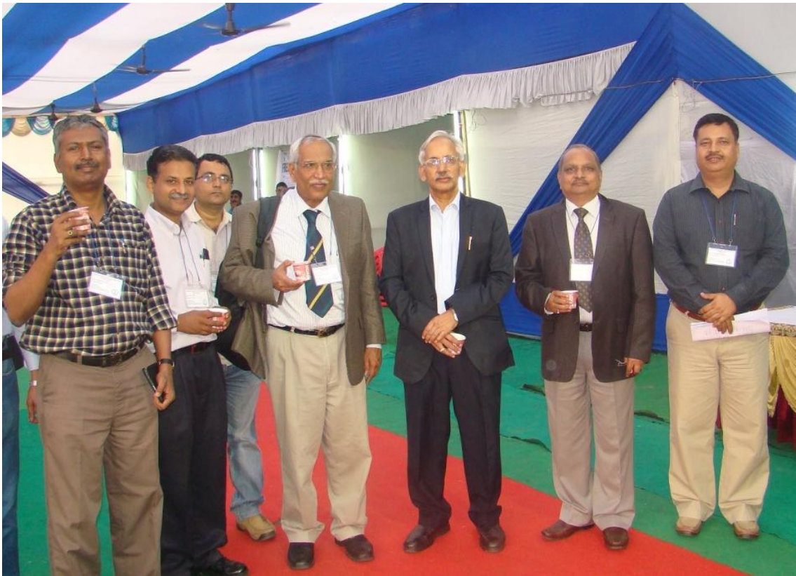
आईओक्यूओ-2014 के प्रतिभागी चार के दौरान