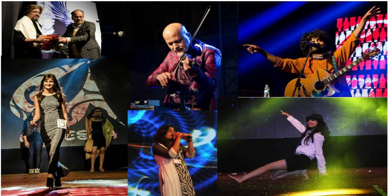
अन्वेषा-2015 का एक दृश्य