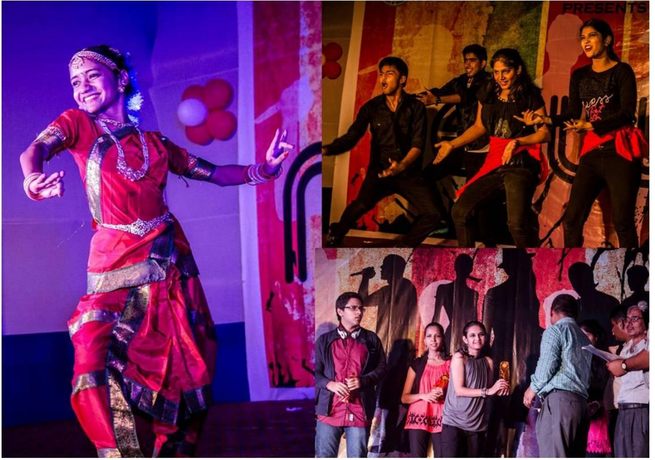
भारतीय प्रौद्योगिकी संस्थान पटना में हुई नेब्युला'2014 का दृश्य